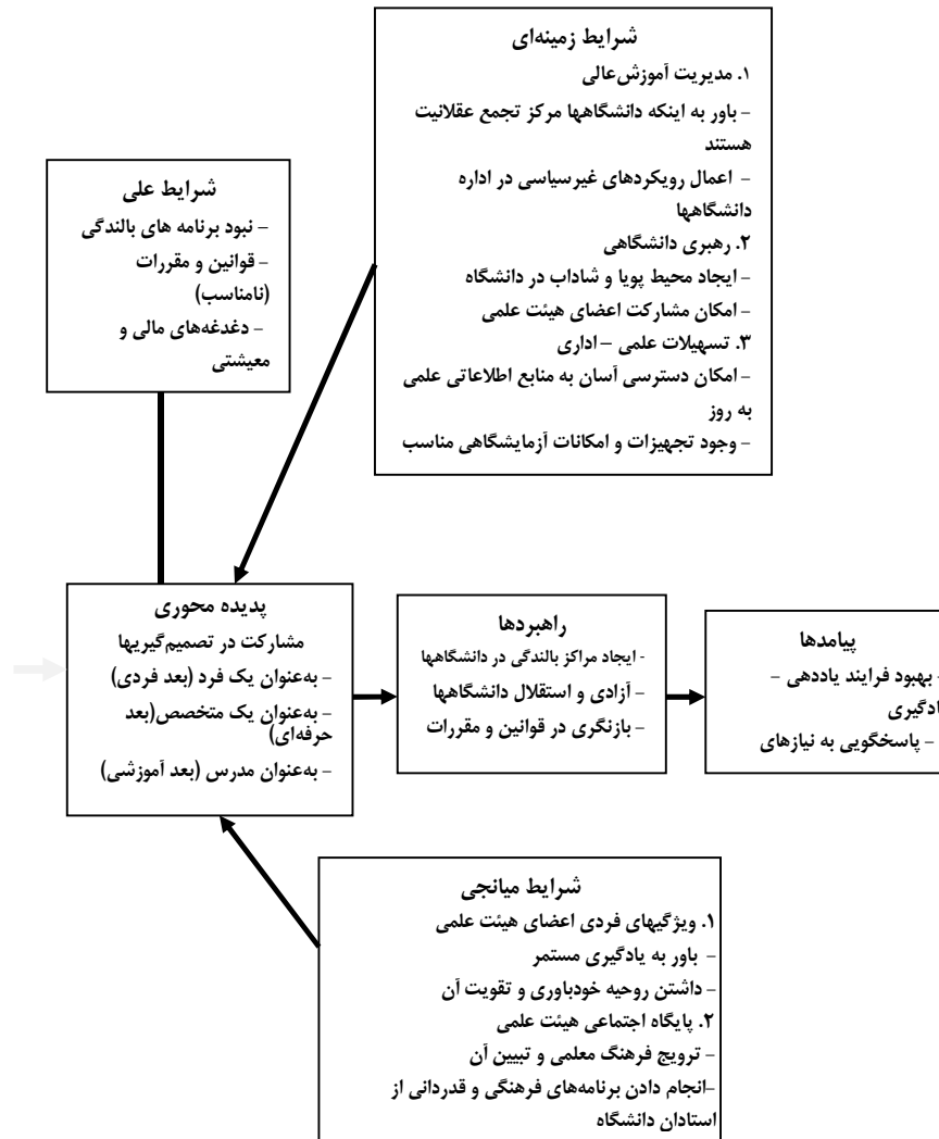
شکل ۲- کدگذاری محوری بالندگی اعضای هیئت علمی